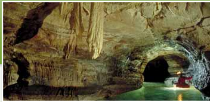
Forschungsarbeiten im Inneren der Höhle

führt auf Wald- und Forstwegen (Parkmöglichkeit) bis zu dem Dolinenfeld, das einen momentanen Höhlenendpunkt markiert. Die eindrucksvollen Karstsenken werden umrundet, bevor der Weg wieder bergab ins Tal führt. Dort wandert man auf der Sommerleite vorbei an artenreichen Magerrasen zurück nach Mühlbach und dem Ausgangspunkt.