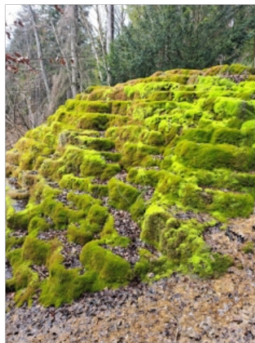
Abb. 2: „Hoher Brunnen“ bei Sollngriesbach