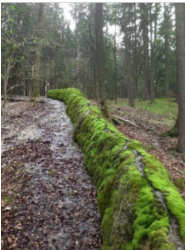
Abb. 1: „Steinerne Rinne“ bei Erasbach

Wir kehren nach Erasbach zurück, fahren über die nächste Albtafel und gelangen nach Greding. Von da aus wandern wir zum Abschluss durch das Kaisinger Tal entlang der Tuffkaskaden des Brunnenbachs (Abb. 3) bis hin zur Karstquelle.