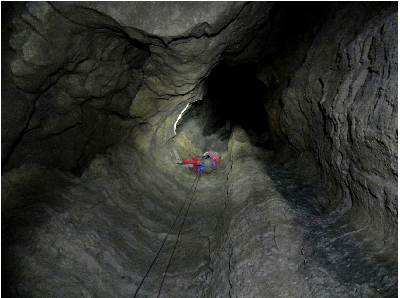
Schacht im Silberloch.